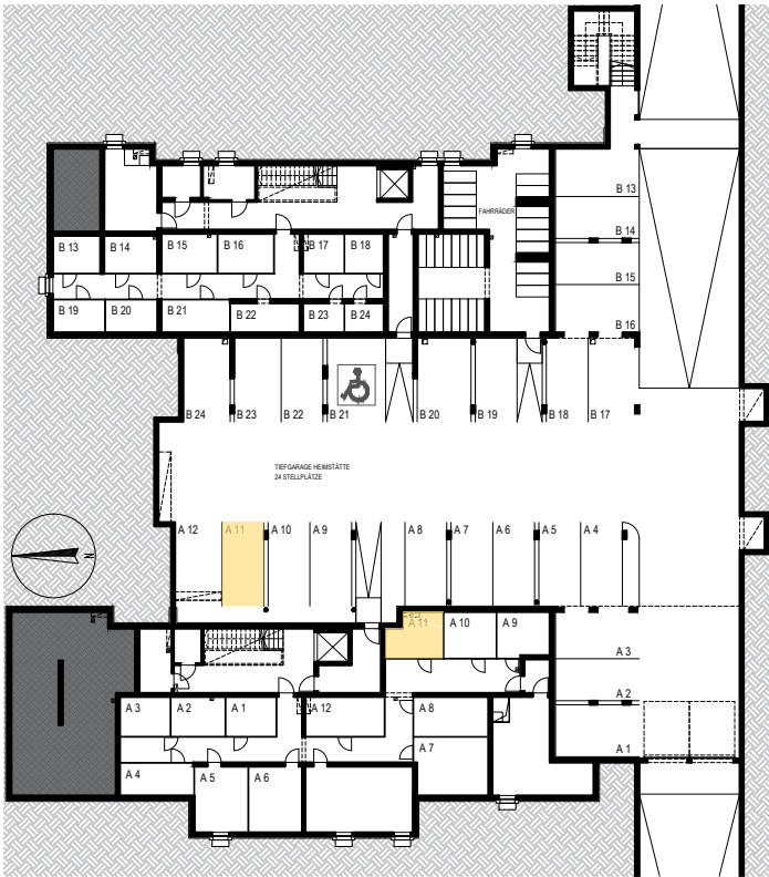
KELLERABTEIL | TIEFGARAGENSTELLPLÄTZE M 1:500