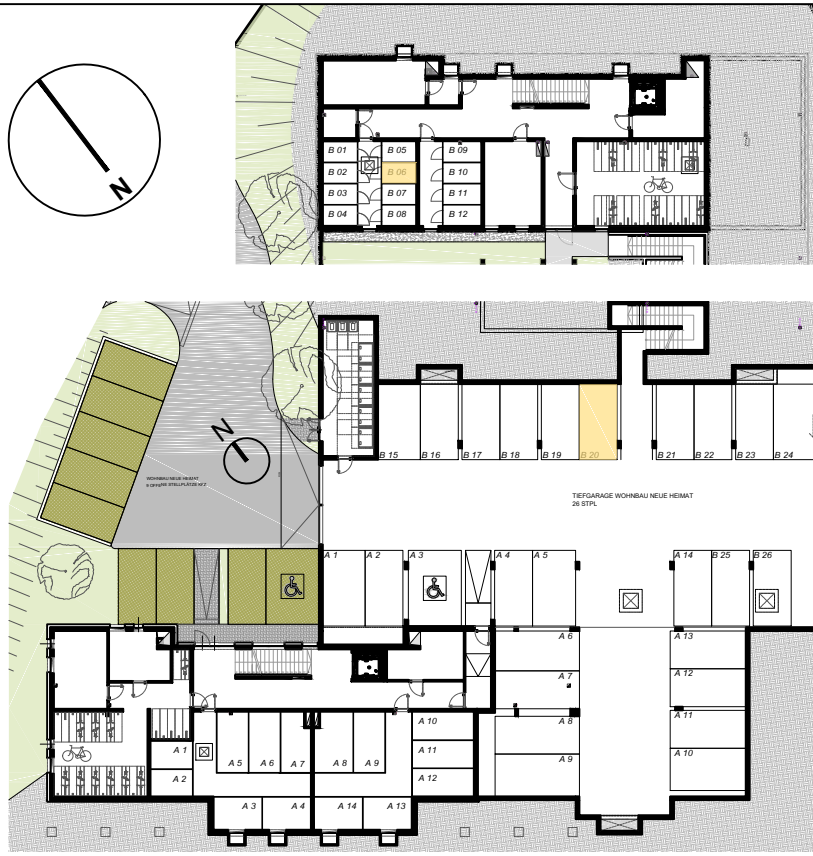
KELLERABTEIL | TIEFGARAGENSTELLPLÄTZE M 1:500