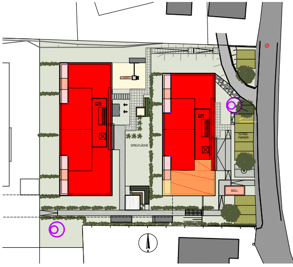
LAGEPLAN M 1:1000