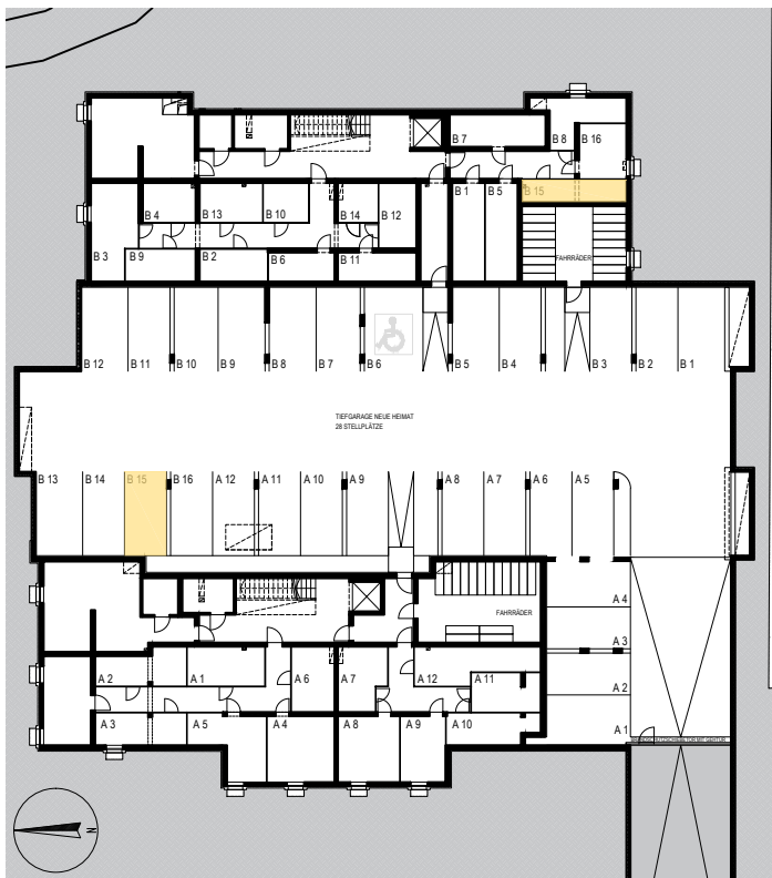
KELLERABTEIL | TIEFGARAGENSTELLPLÄTZE M 1:500