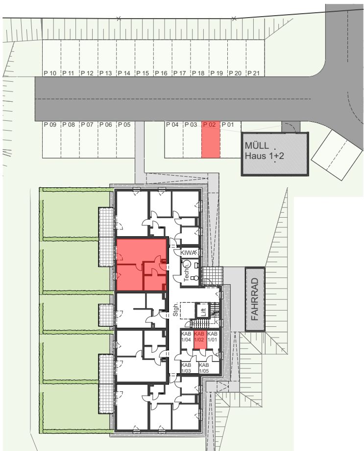
Geschoßübersicht EG 1:500