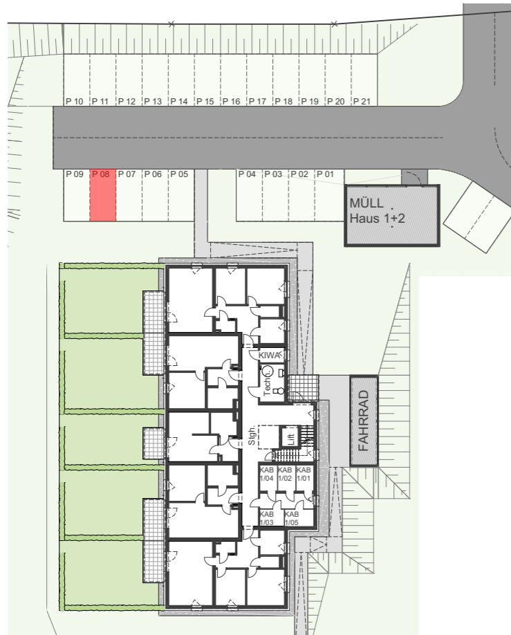
Geschoßübersicht EG 1:500