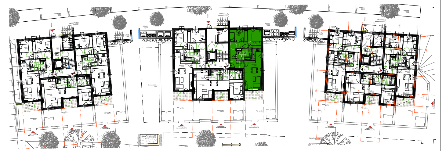
GESCHOSSÜBERSICHT ERDGESCHOSS HAUS D2