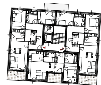
GESCHOSSÜBERSICHT ERDGESCHOSS HAUS D2