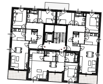
GESCHOSSÜBERSICHT ERDGESCHOSS HAUS D2