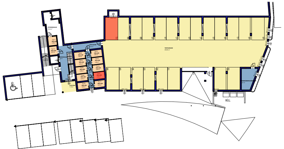
Kellerabteil, Stellplatz TG